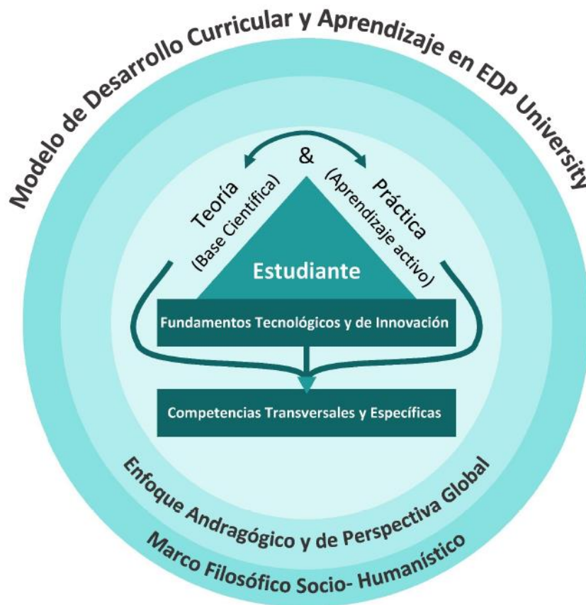
Figura 1: Modelo Educativo de EDP

© Dra. Marilyn Pastrana y colaboradores Enero 2018