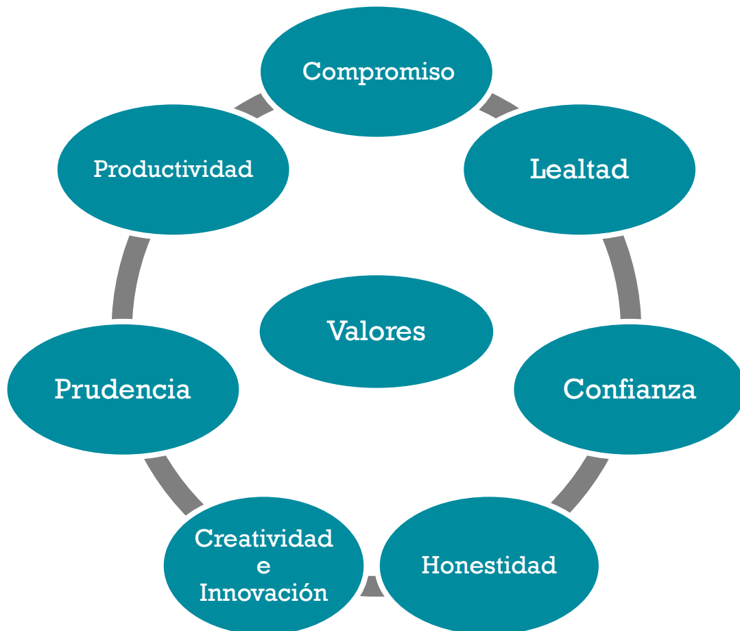
Figura 3: Valores de EDP

Valores que comprometen a la comunidad EDP y que rigen sus acciones se describen y resumen en la figura 3